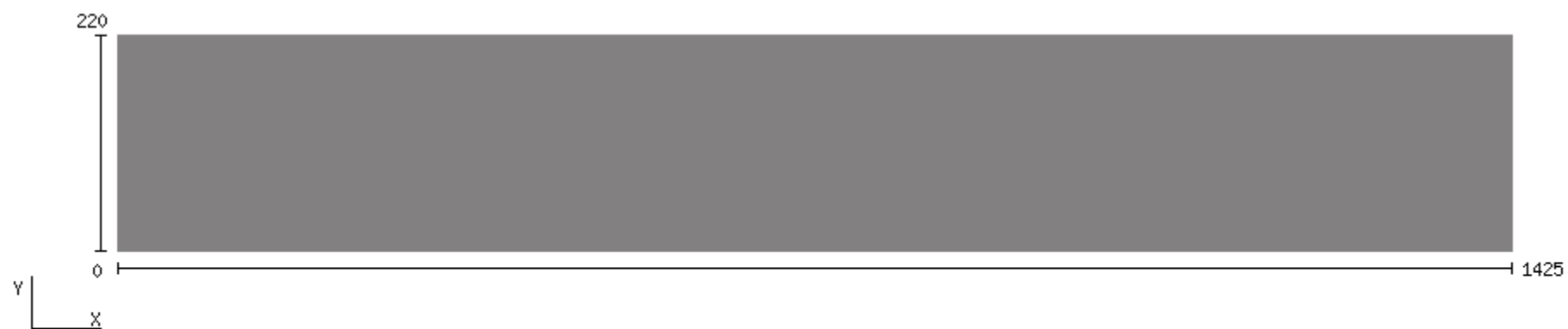
Plaque inox - L 1425 x H 220 mm (142.5 x 22 cm)